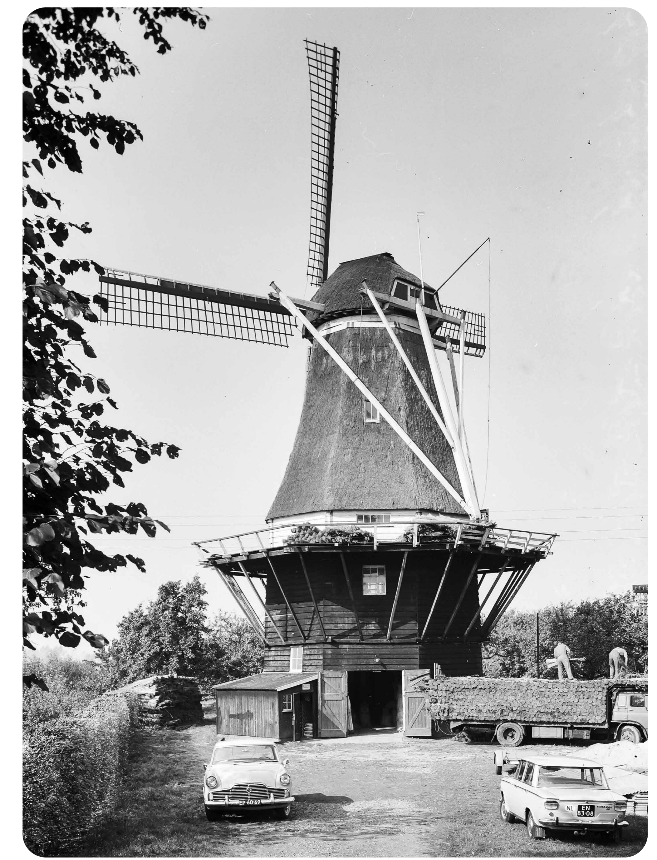
Molen de Vlijt in 1965